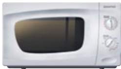
DM 2000 Microwave Oven