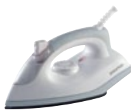
DN 1200 Ironer