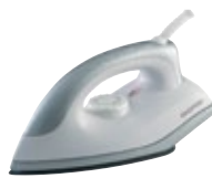
DN 1000 Ironer