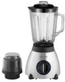
DB 1502 Blender