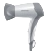
DY 1500 Hair Dryer