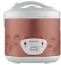
DR 1802 P Rice Cooker