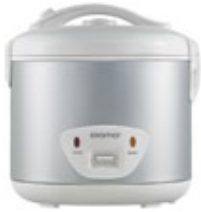
DR 1802 V Rice Cooker