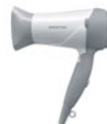
DY 1600 Hair Dryer