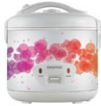
DR 1802 W Rice Cooker