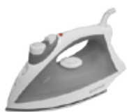
DN 1500 Ironer