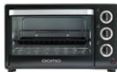
DV 3190 Toaster Oven