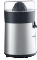
DJ 2000 Orange Juicer