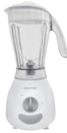
DB 1701 Blender