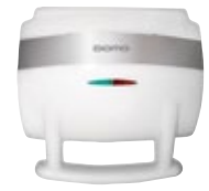
DT 2000 Sandwich Maker